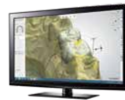
BMCオーダーサイト利用